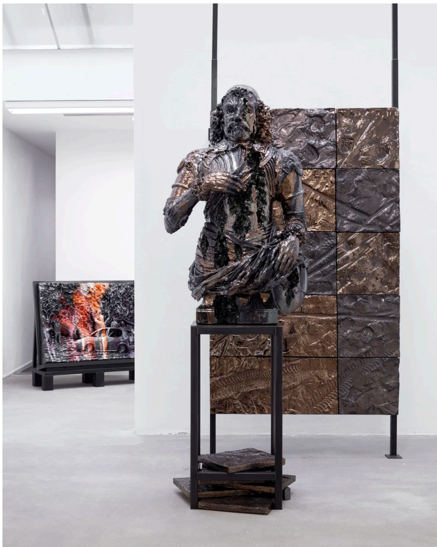
Anne Wenzel, House of Fools (Johan Maurits), 2023, keramiek