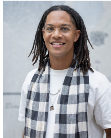
Jaasir Linger