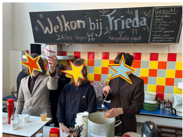
Portret Anon, 2025