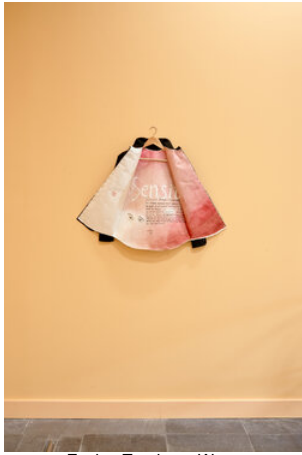
Evelyn Taocheng Wang Sensitive Attitude Watercolour fabric and Xuan- paper on Agnes b. Dress 2019 44x 65 cm Collection of AkzoNobel Art Foundation