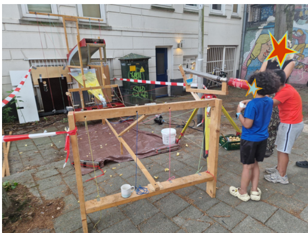
Snackbar Frieda, Frietkanon, 2025