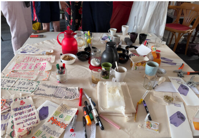
WORKNOT! (Golnar Abbasi and Arvand Pourabbasi) Solidarity Hums, Reading Rhythms Club, 2024