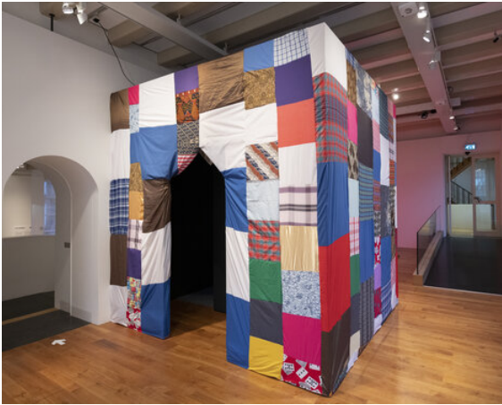
Jaasir Linger, Winti na rutu, 2020