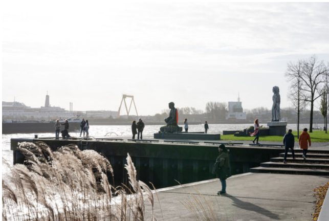
Anne Wenzel Razzia Monument, 2023 Keramik, beton, terrazzo, brons Parkkade, Rotterdam

Uitgevoerd in opdracht van Stichting Razzia Monument Rotterdam en BKOR, ingehuldigd op 10 november 2023