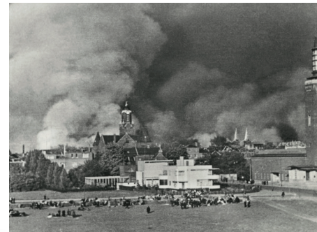
Museumpark, mei 1940.